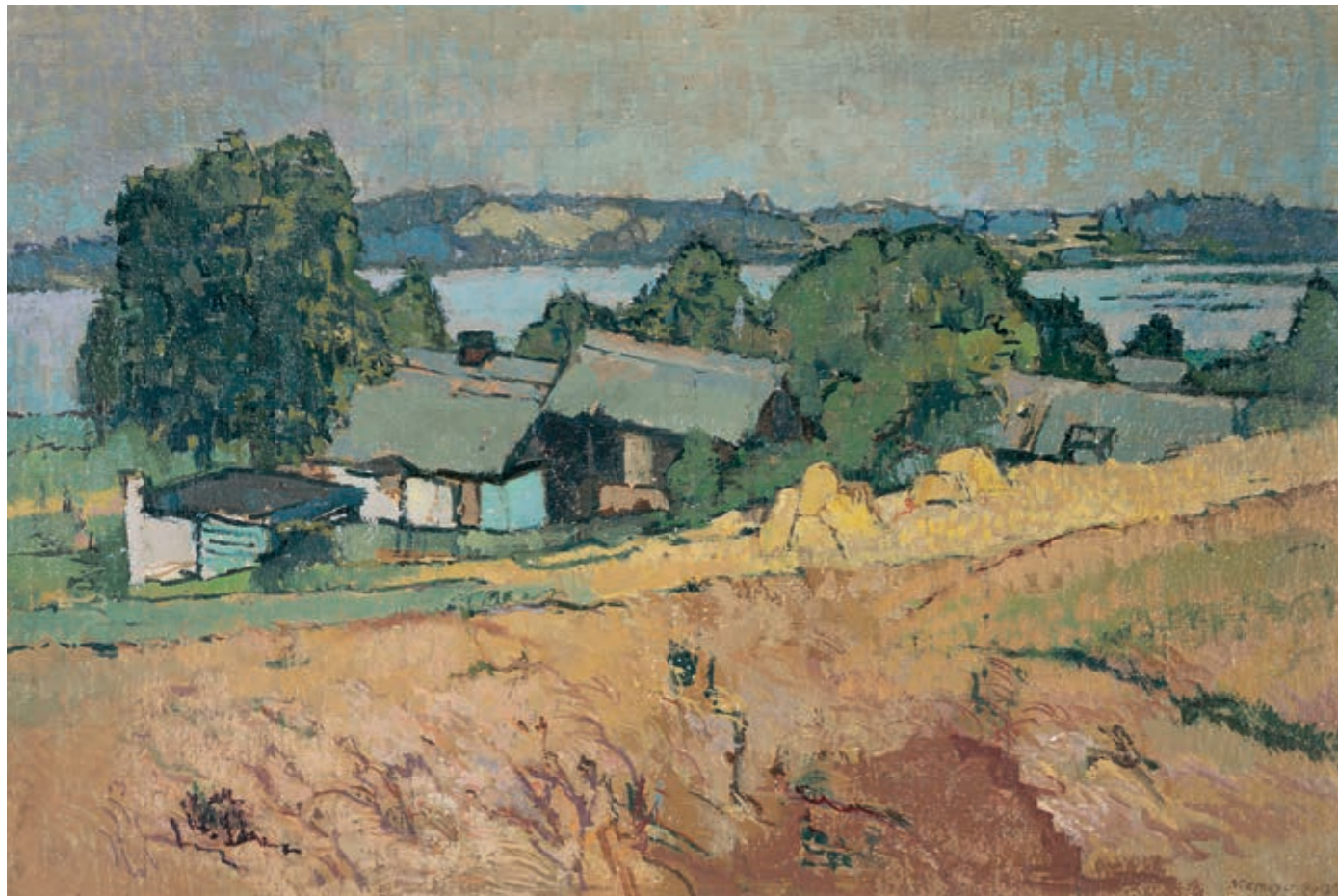
Village au bord du „Schmollensee“, 1955, huile sur toile, 46 x 65 cm