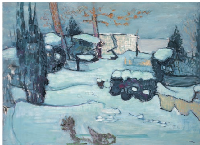
Jardin du cloître en hiver, 1963, huile sur panneau de fibres dur, 69,8 cm x 89,8 cm

„Dans les années cinquante, la peinture d'Otto Niemeyer-Holstein a pris une telle ampleur qu'elle a été déclarée ‚pilier fondamental‘ de l'art humaniste en RDA, équivalente aux œuvres de Rosenhauer, Kretschmar, Wigand et Glöckner de Dresde. Une réalisation exceptionnelle de la peinture de Niemeyer est la représentation de la côte de la mer Baltique, qui va au-delà de la piété pour sa patrie. Au sommet de ses capacités, l'artiste savait transformer l'impression de la nature complètement en une œuvre d'art. Le motif est spiritualisé dans le langage des couleurs. Bien que l'observation de la nature reste visible, l'objet perd son caractère direct de représentation au profit d'une affirmation dans laquelle domine une interprétation spirituelle fine. Cette peinture, inspirée