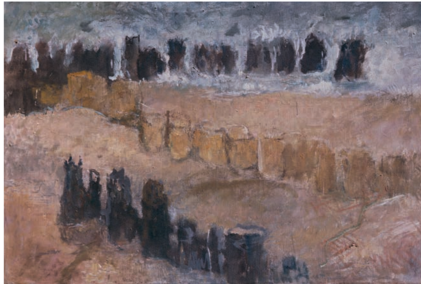
Falochrony II, 1974, Farba olejna na płótnie, 95 cm x 130 cm