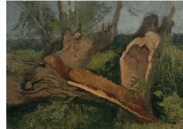
Pęknięte drzewo, 1945, Farba olejna na płótnie, 45,0 cm x 56,6 cm