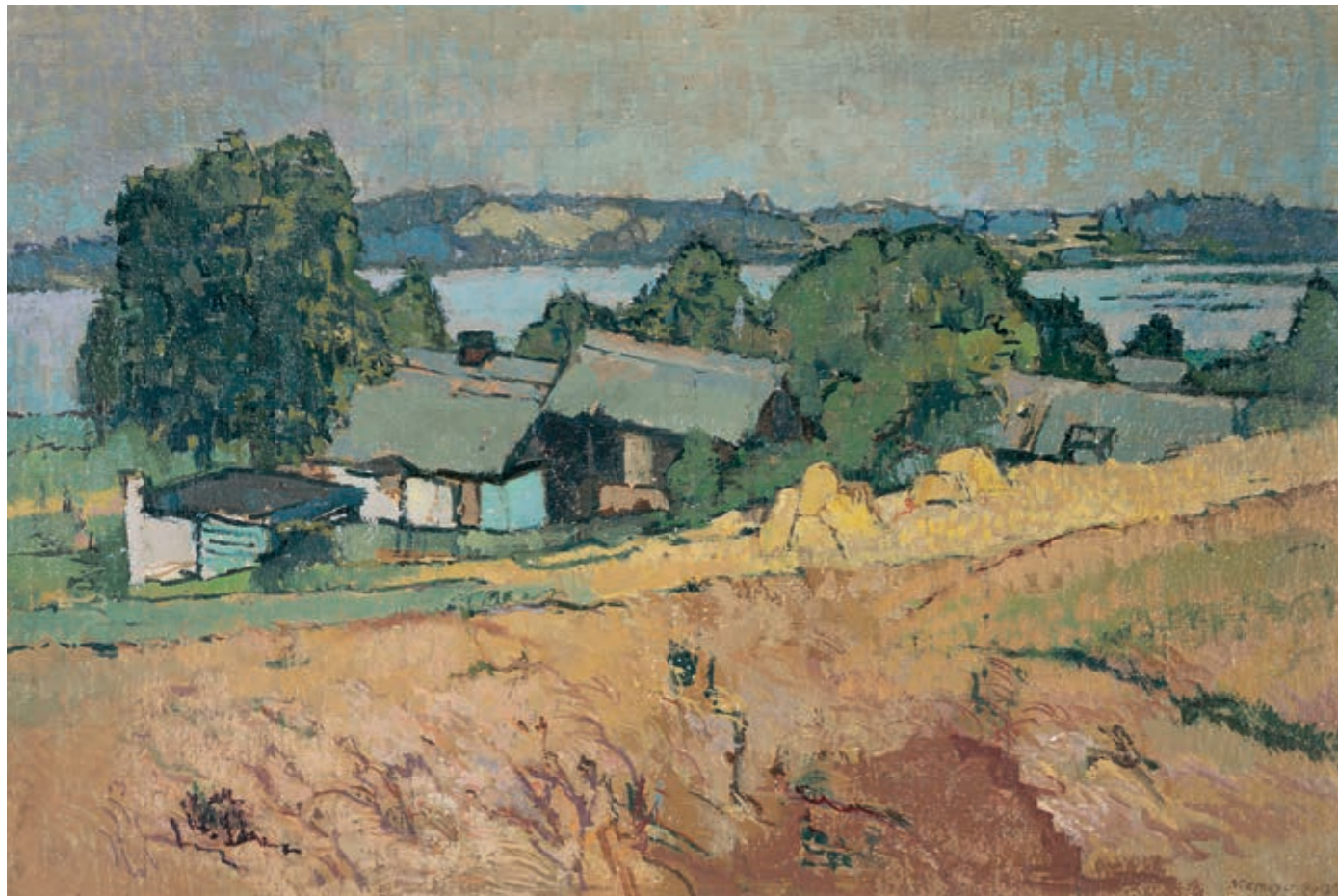
Wioska nad Jeziorem Schmollen, 1955, olej na płótnie, 46 x 65 cm

Rozwój artystyczny Otto Niemeyera-Holsteina rozpoczął się w roku 1917, kiedy artysta zajmował się nurtami i stylami początku XX wieku. Ekspresjonizm i social realism wywarły na artystę ogromny wpływ, który przejawiał się również w jego późniejszych dziełach. Nie bez znaczenia dla artystycznego rozwoju Holsteina, który uważany był za „samouka”, okazały się spotkania z Alexejem von Jawlenskym, Marianne von Werefkin i Arthurem Segalem w Asconie/kanton Ticino (Szwajcaria). Jego artystyczny język rozwijał się, krążąc wokół pewnej powiązanej całości, w ciągłym kontemplowaniu natury.