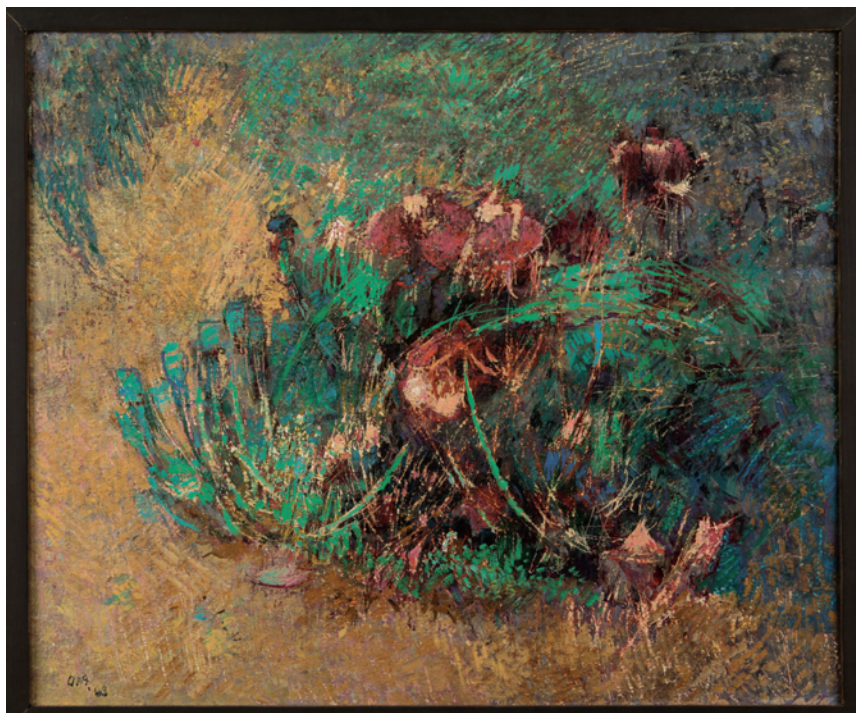
Otto Niemeyer-Holstein: Vergehender Mohn Öl auf Leinwand, 50 cm breit, 60 cm hoch 1968, WV 1841