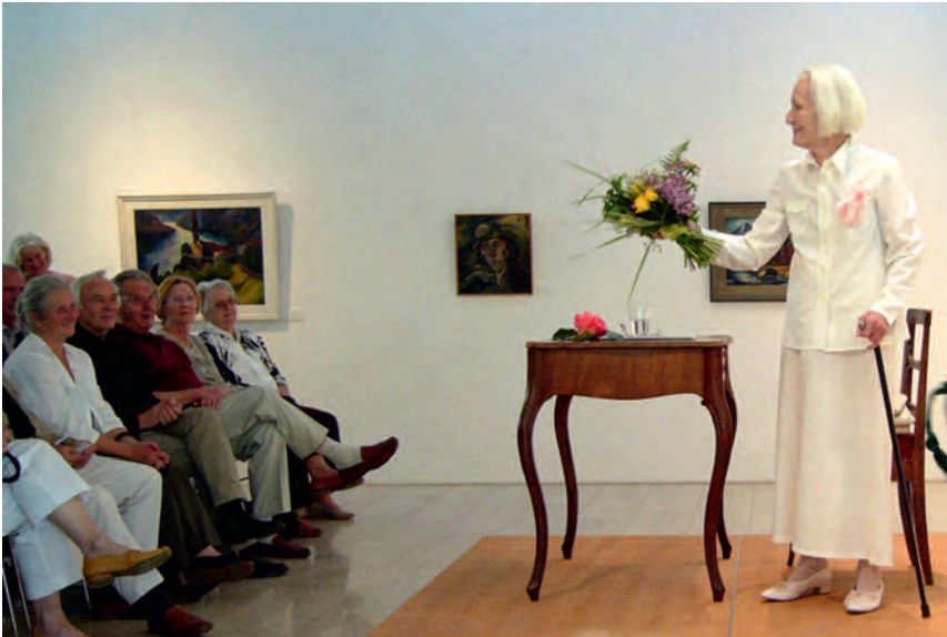
Inge Keller am 11.5.2008 in der Neuen Galerie