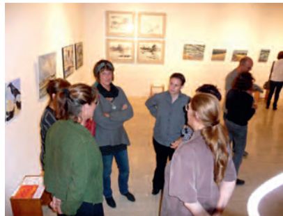
Im Anschluss an das Pleinair werden die entstandenen Arbeiten bei einem Atelierfest in der Neuen Galerie präsentiert.