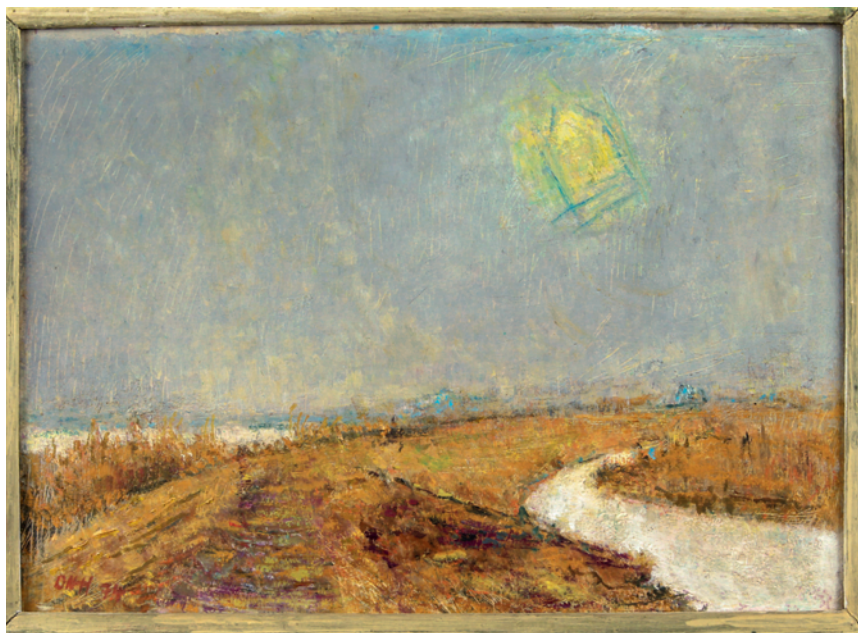
Otto Niemeyer-Holstein: Deichlandschaft Öl auf Hartfaser, 33cm hoch, 45 cm breit 1973, WV 2129

als Dauerleihgabe an das Museum Atelier Niemeyer-Holstein